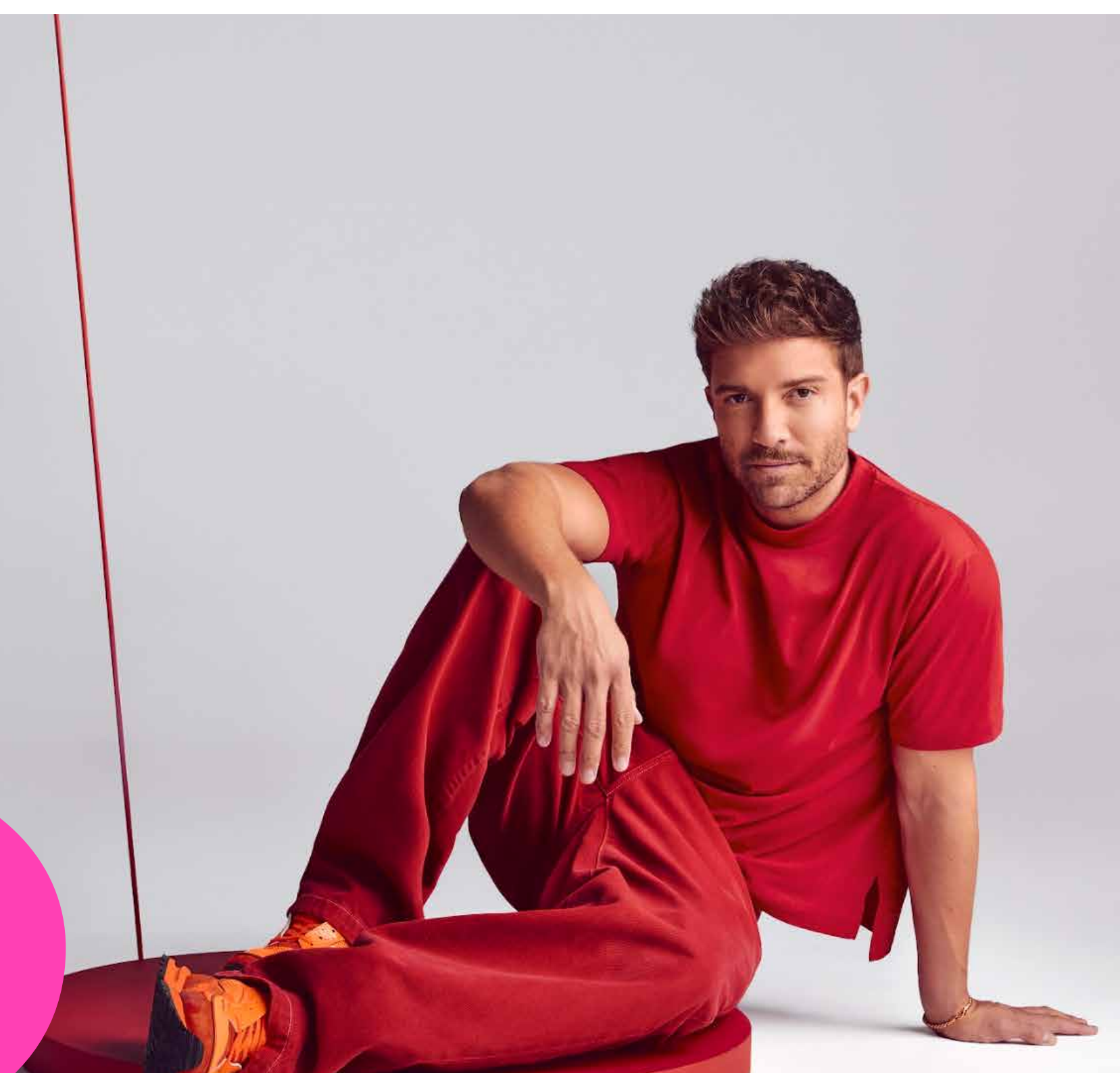
PABLO ALBORÁN ESPAÑA